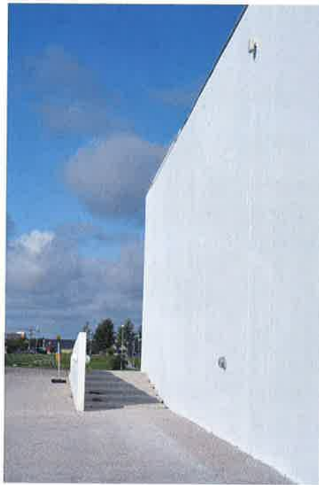
Kunstmuseet Arken ved Ishøj malet med Faceal Oleo Color.

en overfladebeskyttelse baseret på samme teknologi som f.eks. Teflon. Produktnavnet er "Faceal Oleo", og "hemmeligheden" ved produktet er, at det nedbringer det behandlede materiales overfladespænding, således at det beskytter mod væsker og partikler med en højere overfladespænding. Produktet anvendes på blandt andet beton, natursten, træ og teglsten.