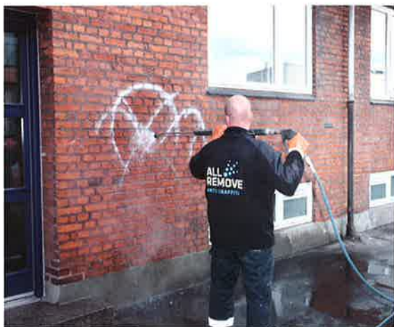
• Servicemand fra All Remove i gang med at fjerne TAGS.

Imprægnering All Remove Protect Vind og vejr udsætter sammen med fugt, sod og andre nedbrydende stoffer til stadighed bygninger, broer, bygningsinventar for tæring og nedbrydning. All Remove Protect imprægnerer bygnings overflader med