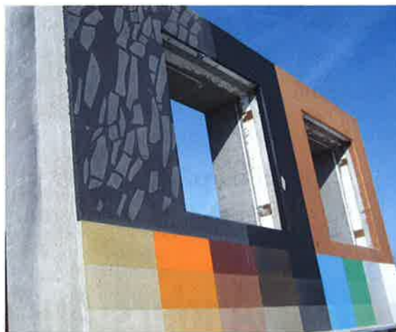
• Mock up hos Spændcom – prøveopstrygninger med Faceal Oleo Color.