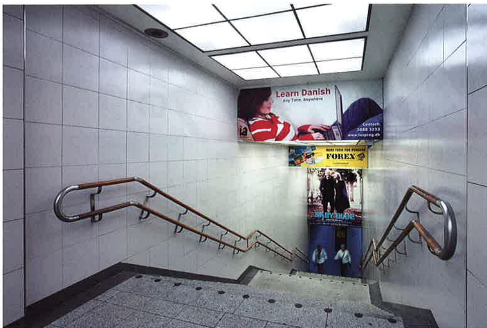
Trapperum på Nørreport Station efter afrensning af graffiti i forbindelse med DSB's projekt "Rene Linier".

påføres. Når overfladen herefter udsættes for graffiti kan den beskyttende hinde og malingen spules af med varmt vand. Det efterlader ingen spor, og overfladen kan igen påføres et beskyttende lag PSS 20.