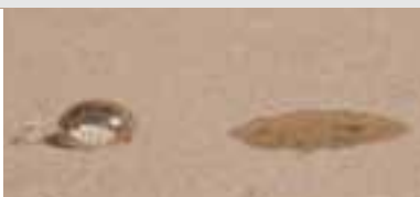
Alm. fugtimprægnering. Vand afvises, men olie trænger igennem.