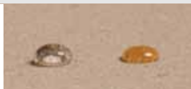
Faceal Oleo HD. Vand og olie afvises.