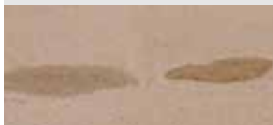
Ubehandlet overflade. Vand og olie trænger ned i overfladen.